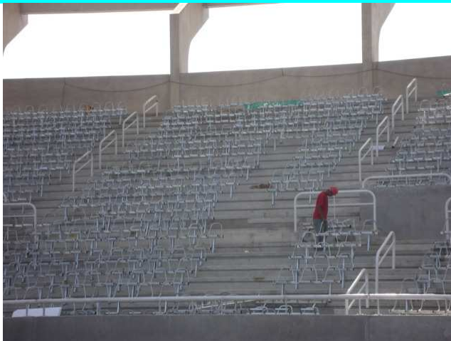
Figuras 15 – Suportes dos bancos colocados.