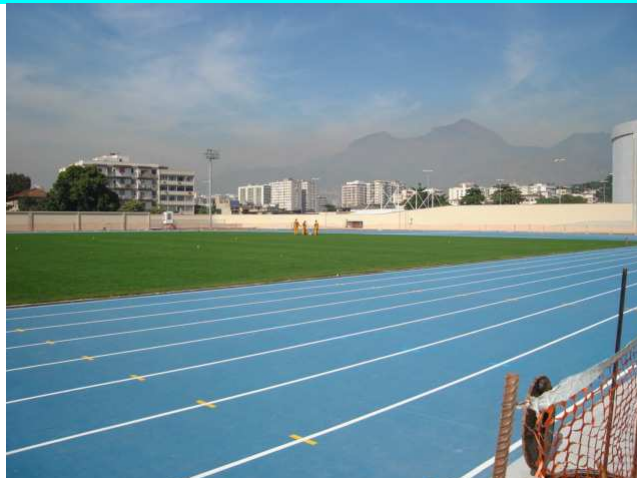
Figuras 13 e 14 – Pintura da pista de "warm up" concluída