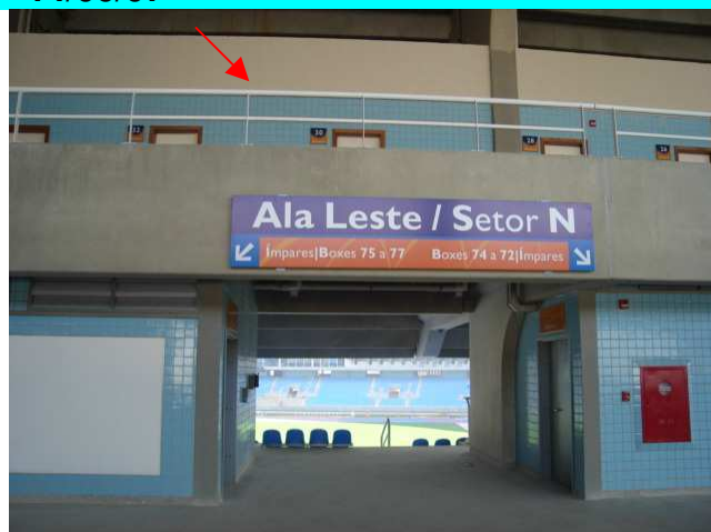
Figura 10 – Acabamento do nível 33,30 e parapeito.