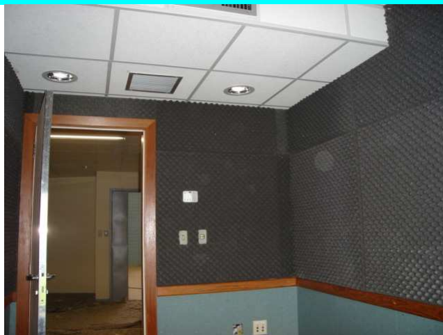
Figura 4 – Tratamento termo-acústico da cabine de locução da Sala de imprensa – nível 40,90