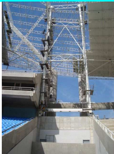
Figuras 7 e 8 – Locais para instalação dos displays digitais nos setores Nordeste e Noroeste