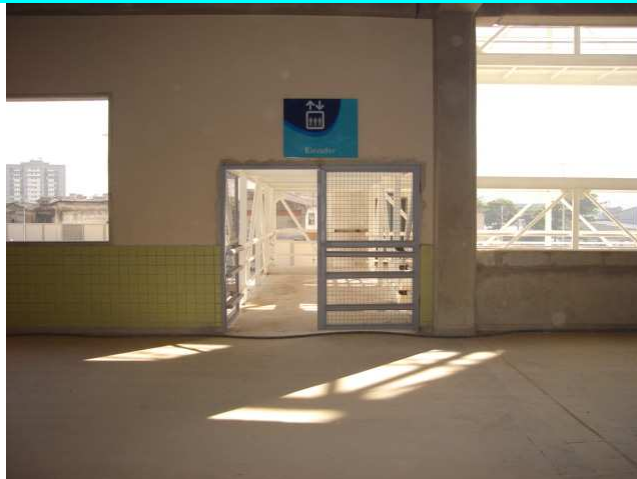
Figuras 17 e 18 – Acabamentos e esquadrias – nível 33,30