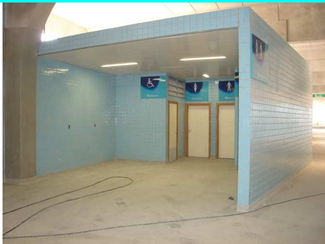
Figura 1 – Acabamento - nível 33,30.