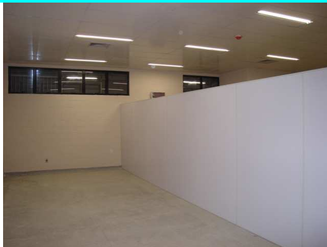
Figura 2 – Sala do nível 22,10.