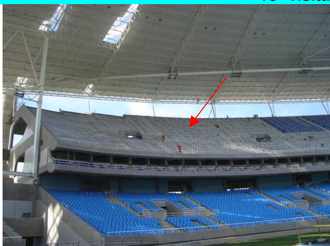
Figura 9 – Detalhe do trecho a colocar assentos nos níveis superiores