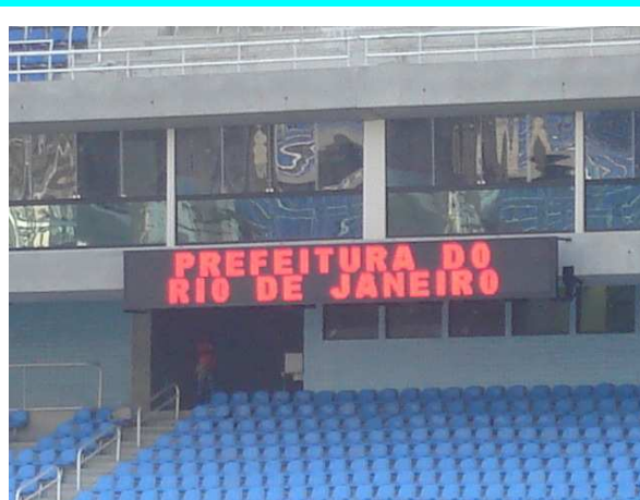
Figura 6 – Placar eletrônico instalado.