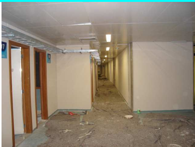
Figura 3 – Acabamento e rebaixo da Sala de imprensa – nível 40,90