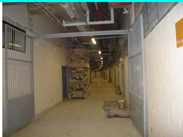
Figuras 11 e 12 – Acabamento e instalações - nível 22,10.