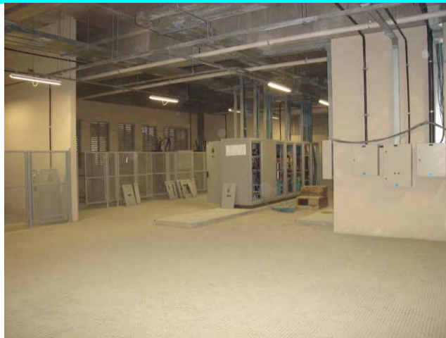
Figura 16 – Subestação.