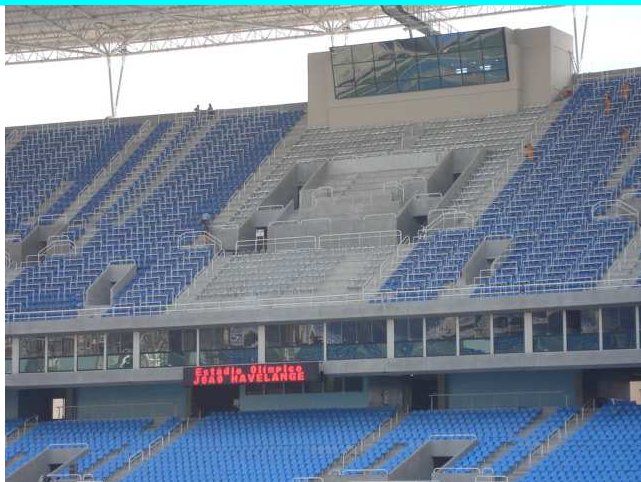
Figura 5 – Cadeiras instaladas.