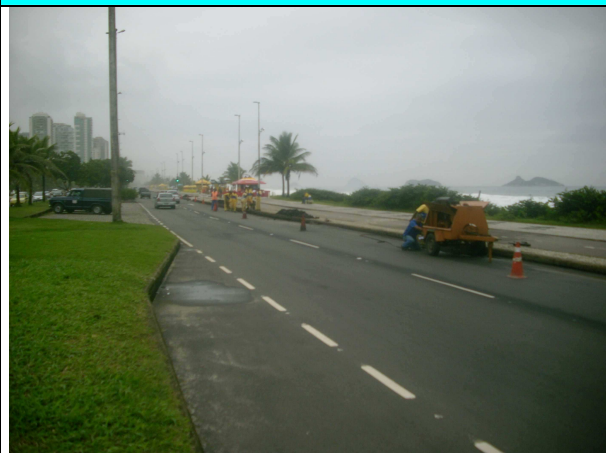
Figura 7 – Execução de sarjeta na Av. Lúcio Costa (altura do nº 4420)