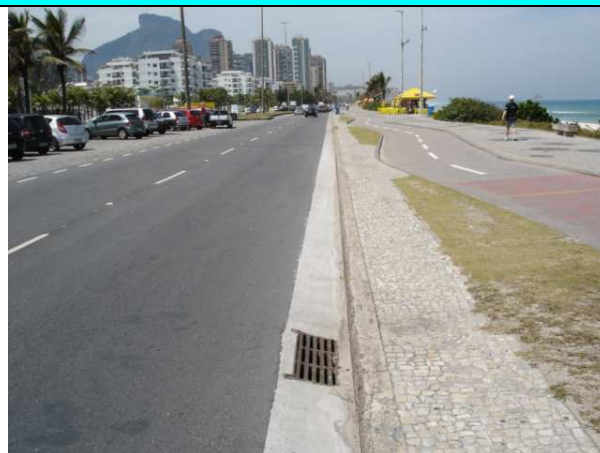
Figura 8 – Sarjeta implantada na Av. Lúcio Costa.