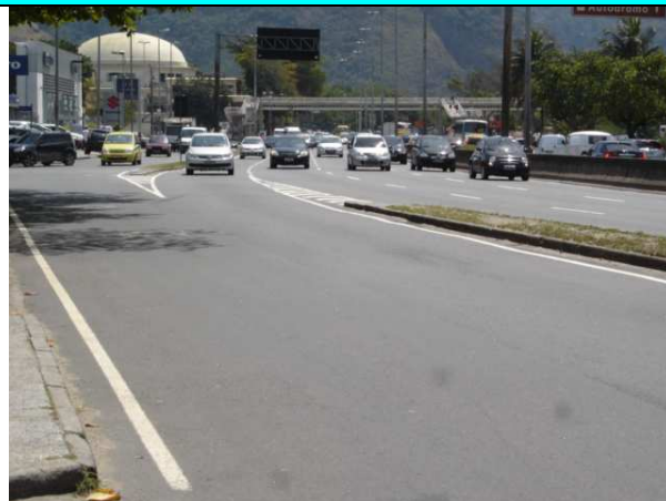
Figura 6 – Sinalização horizontal executada na pista lateral da Av. Ministro Ivan Lins.