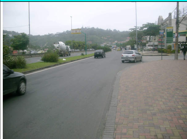
Figura 5 – Restauro da pavimentação na pista lateral da Av. Ministro Ivan Lins (altura do Barra Sul, sentido Joá), restando a execução da sinalização horizontal.