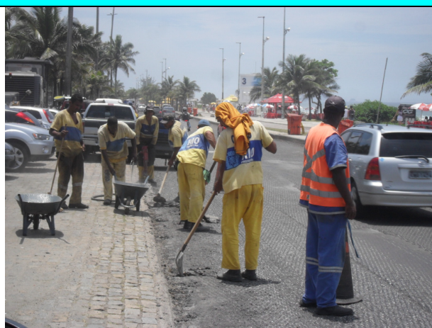
Figura 11 – Avenida Lúcia Costa (altura do nº 2916 – Pista da Praia): serviços de fresagem e limpeza de bordos em execução