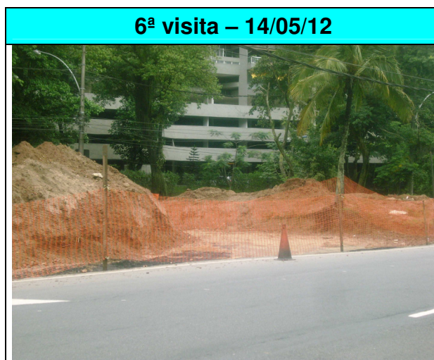
Figura 15 - Construção de retorno na Estrada da Barra da Tijuca, próximo ao Clube Marina.