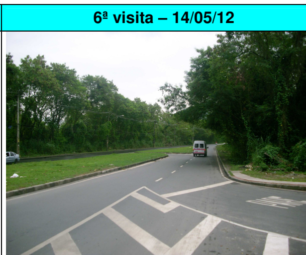
Figura 14 - Readequação geométrica na Estrada de Jacarepaguá com Av. Eng. Sousa Filho.