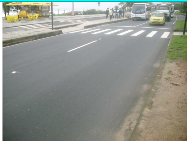
Figura 10 – Serviços de pavimentação e pintura de sinalização horizontal concluídos.