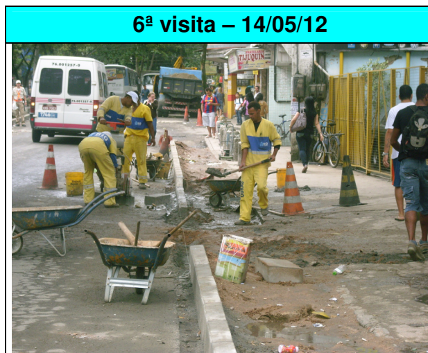
Figura 13 - Readequação de calçadas na localidade do Tijuquinha (Est. do Itanhangá na altura da Rua Jabuticaba).