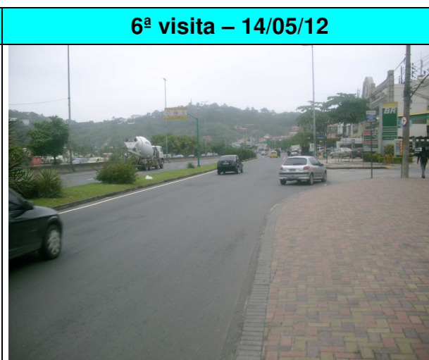
Figura 16 - Restauro da pavimentação na pista lateral da Av. Ministro Ivan Lins (altura do Barra Sul, sentido Joá), restando a execução da sinalização horizontal.