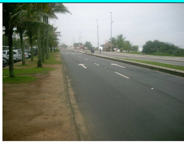
Figura 12 – Serviços concluídos, incluindo pavimentação e sinalização horizontal.