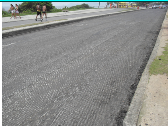
Figura 9 – Avenida Lúcio Costa (altura do nº 2916 – Pista da Praia): serviços de fresagem e limpeza de bordos em execução