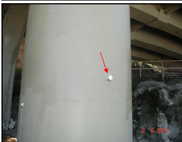
Figura 04 – Pilar 19 onde se pode ver a sonda necessária para ensaio técnico.