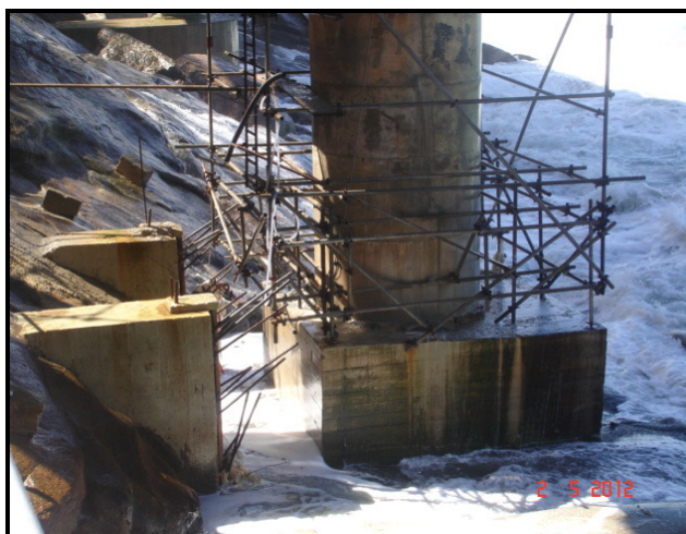
Figura 02 – Pilar 23A em contato permanente com o mar.