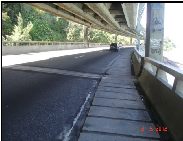
Figura 11 – Vista geral do viaduto das bandeiras