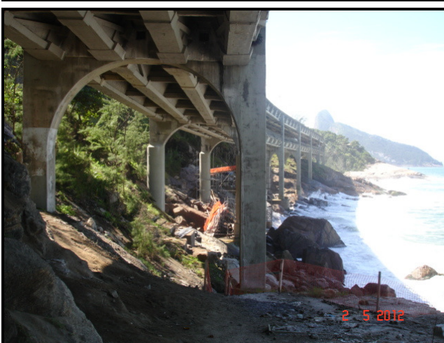
Figura 03 – Pilares 20 e 21 em fase de recuperação.