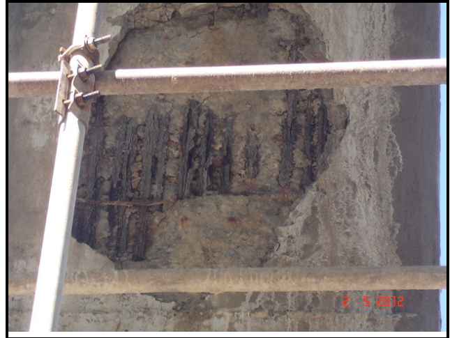
Figura 10 – Corrosão avançada em pilar do viaduto.