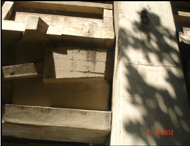
Figura 09 – Intersecção de longarina e pilar: apoio oculto, sem possibilidade de avaliação imediata.