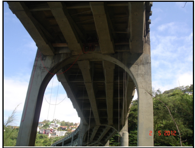
Figura 06 – Vista das longarinas na altura do Pilar 09.