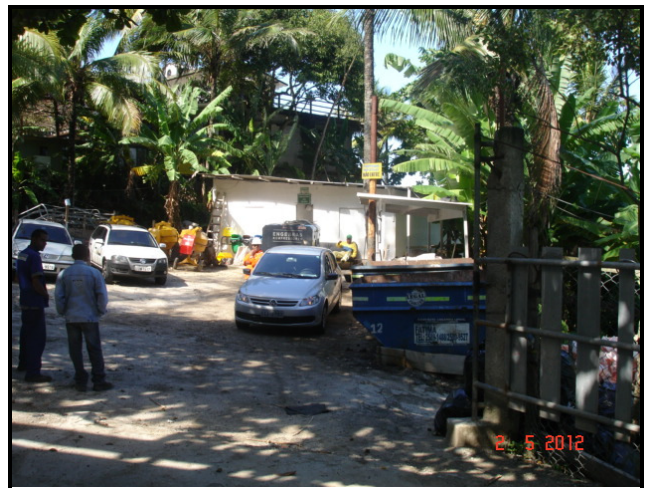
Figura 12 – Canteiro de obras