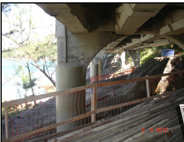
Figura 01 – Pilar 19A sendo recuperado.