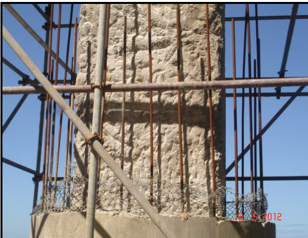
Figura 07 – Execução do reforço do Pilar 08.