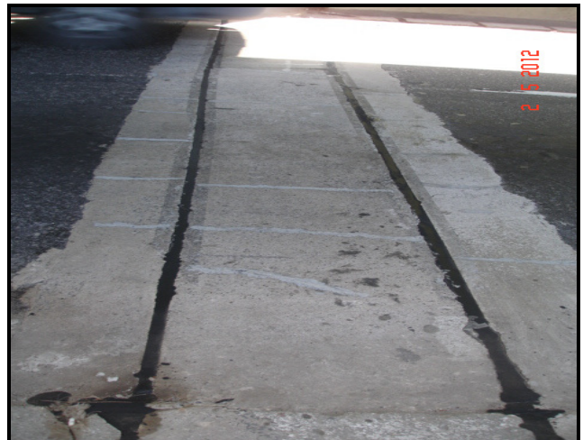
Figura 08 – Juntas de dilatação ao longo do elevado.