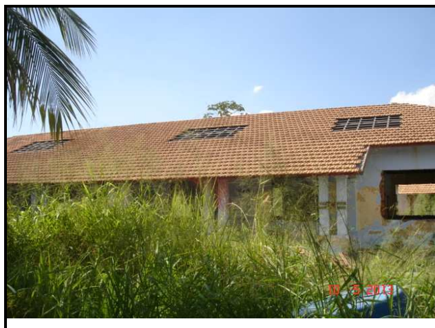
Figuras 10 e 11 – Somente os telhados dos Pavilhões sofreram intervenção.