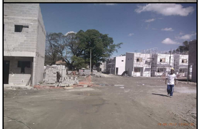
Figuras 04 a 09- Ângulos diferentes das casas em execução, em alvenaria.