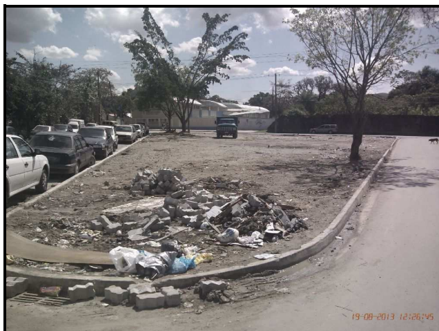
Foto 30 - Praça 11 - a executar.