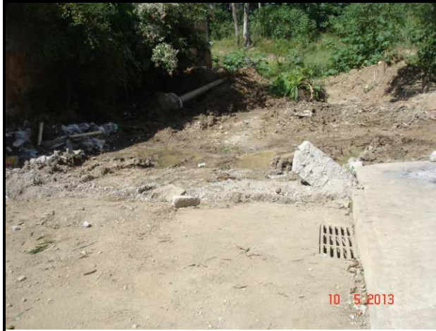
Figura 14 – Trecho da Rua Nossa Senhora de Fátima com infraestrutura executada, sem pavimentação.