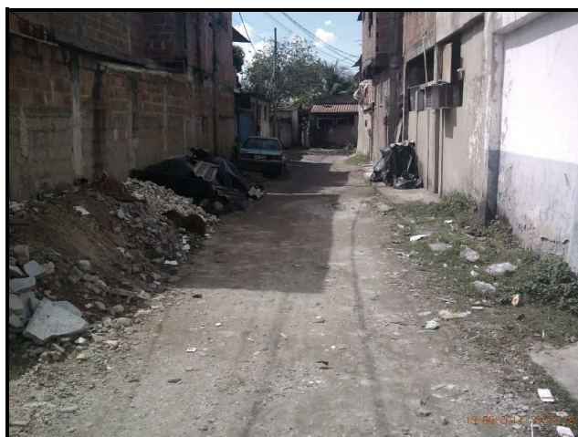
Foto 33 - Rua N. Sra. de Fátima 5 - a executar.