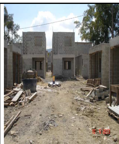
Figuras 01,02 e 03 - Três ângulos diferentes das casas em execução, em alvenaria.