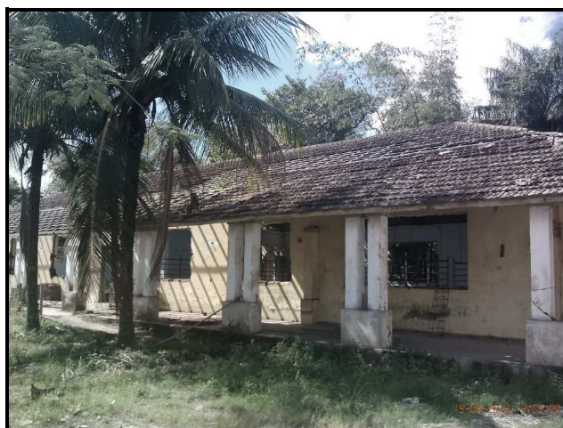
Figuras 12 e 13 – Pavilhões em reforma.