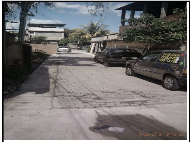
Figura 19 – Trecho concluído.