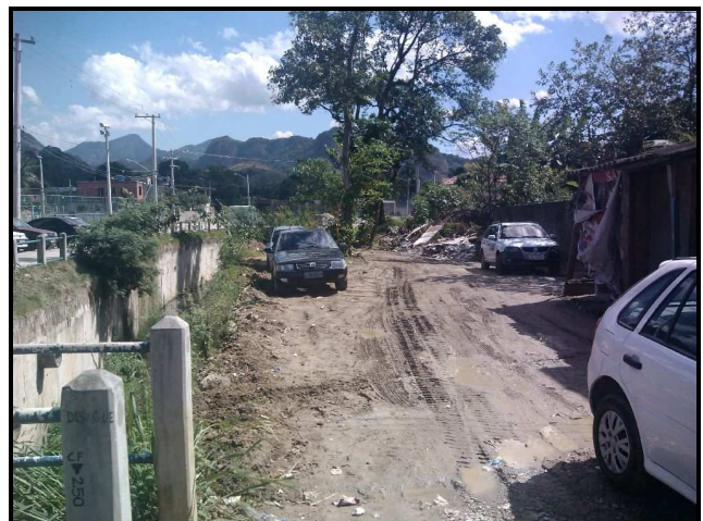
Foto 25 – Rua Sem Nome 12 (sentido contrário). Prevista a pavimentação asfáltica.