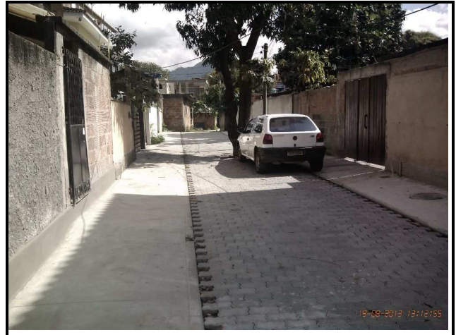
Figura 23 – Faltando pequenos arremates.