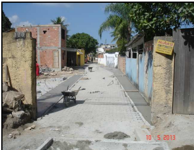
Figura 16 – Rua Sampaio Correa, 116: trecho em execução.