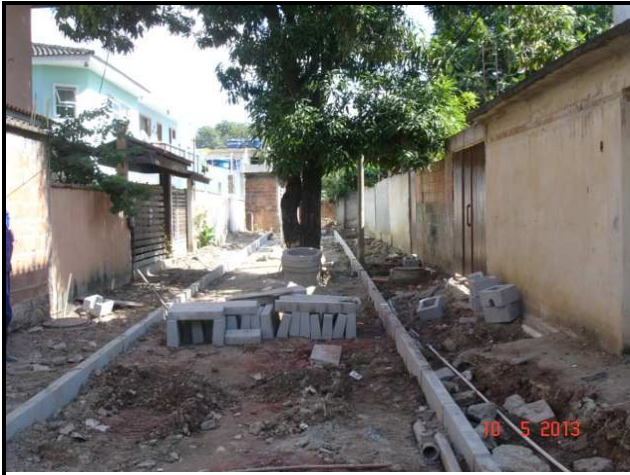
Figura 22 – Rua Sampaio Correa, 110 A - em execução.