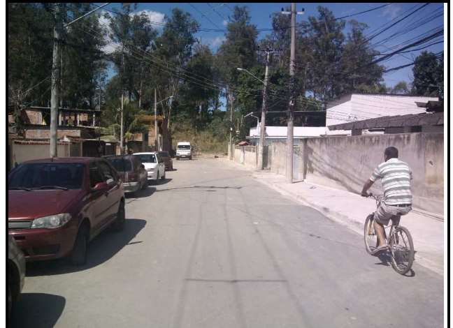
Figura 15 – Trecho concluído.