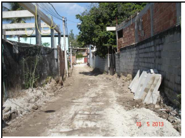
Figura 20 – Rua Sampaio Correa, 110: pavimentação a executar.