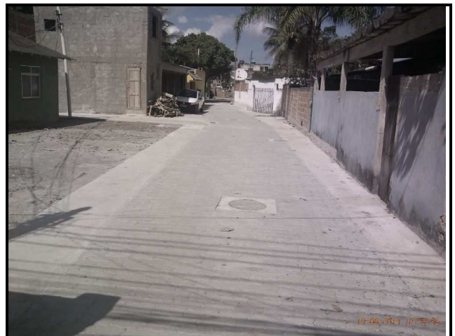
Figura 17 – Trecho concluído.