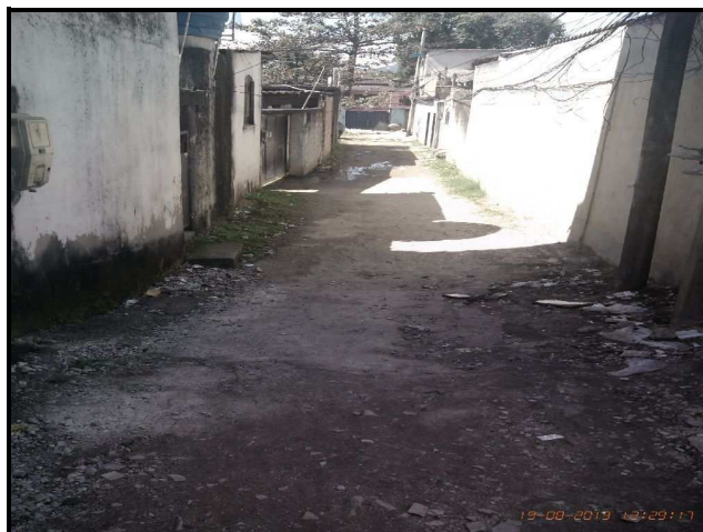
Foto 31 - Rua N. Sra. de Fátima 1 - a executar.