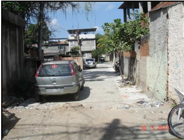
Figura 18 – Rua Sampaio Correa, 130F: finalizando a execução.