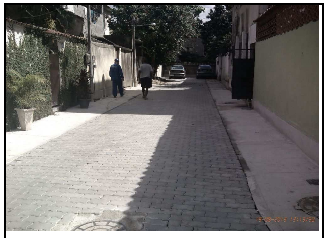
Figura 21 – Faltando pequenos arremates.