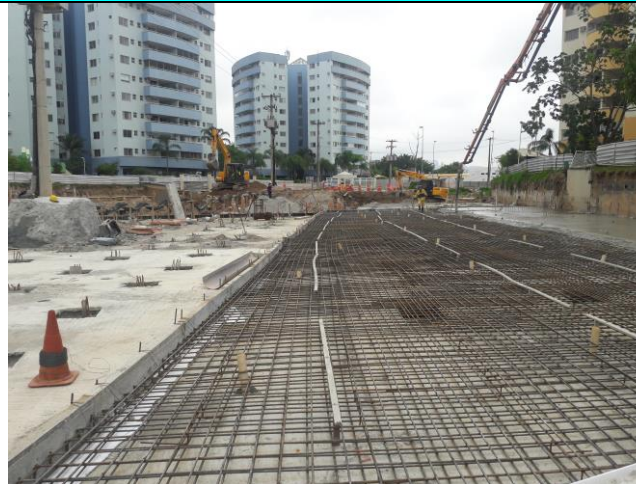
Figura 05 – Distribuição de ferragem