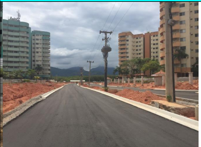
Figura 08 – Trecho com pavimento já executado.