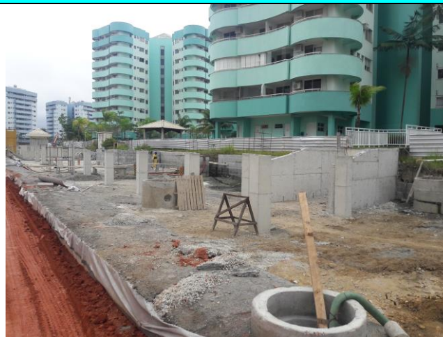
Figura 07 – Vista da obra: via, pilares e muro de concreto armado.