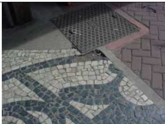
Figura 24 - Ausência de pedras portuguesas em frente à Rua Marquês de Abrantes, nº 168, próximo à entrada do prédio.