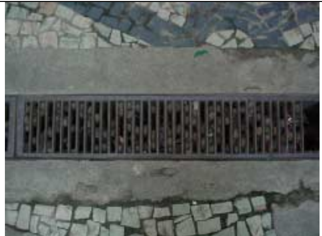
Figura 17 – As sementes das amendoieiras obstruem as grelhas e dificultam a drenagem na saída da Estação Flamengo do metrô.