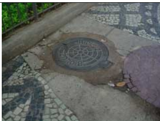
Figura 32 - Descaracterização da paginação da calçada em frente ao nº 11 da Rua Marquês de Abrantes.