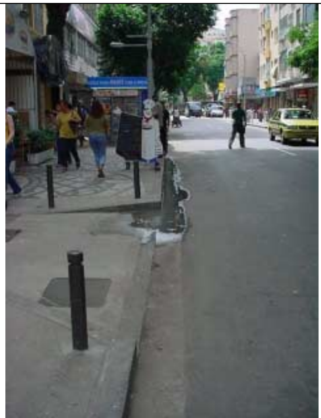
Figura 19- Água empoçada em frente à Rua Marquês de Abrantes, nº 100.