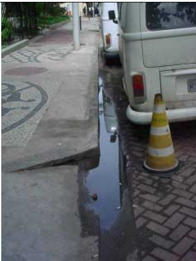
Figura 18 – Água empoçada em frente à Rua Marquês de Abrantes, nº 189