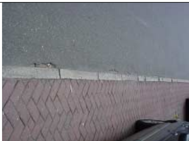
Figura 13 - Defeito no pavimento entre o nº 119 e 115 da Rua Marquês de Abrantes.