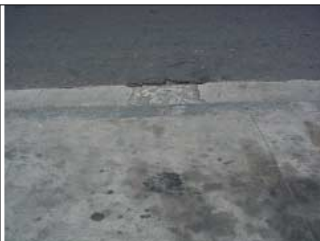
Figura 33 - Desgaste do acesso ao posto de gasolina da Rua Marquês de Paraná .