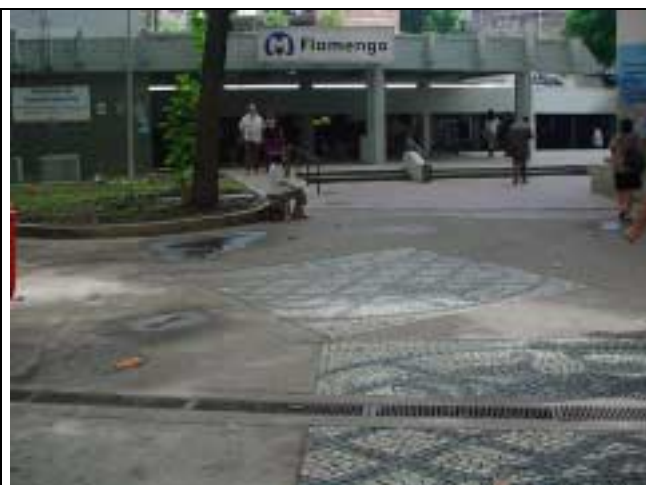
Figura 14 - Poças de água e falta de conservação dos jardins, na saída da Estação Flamengo do metrô.