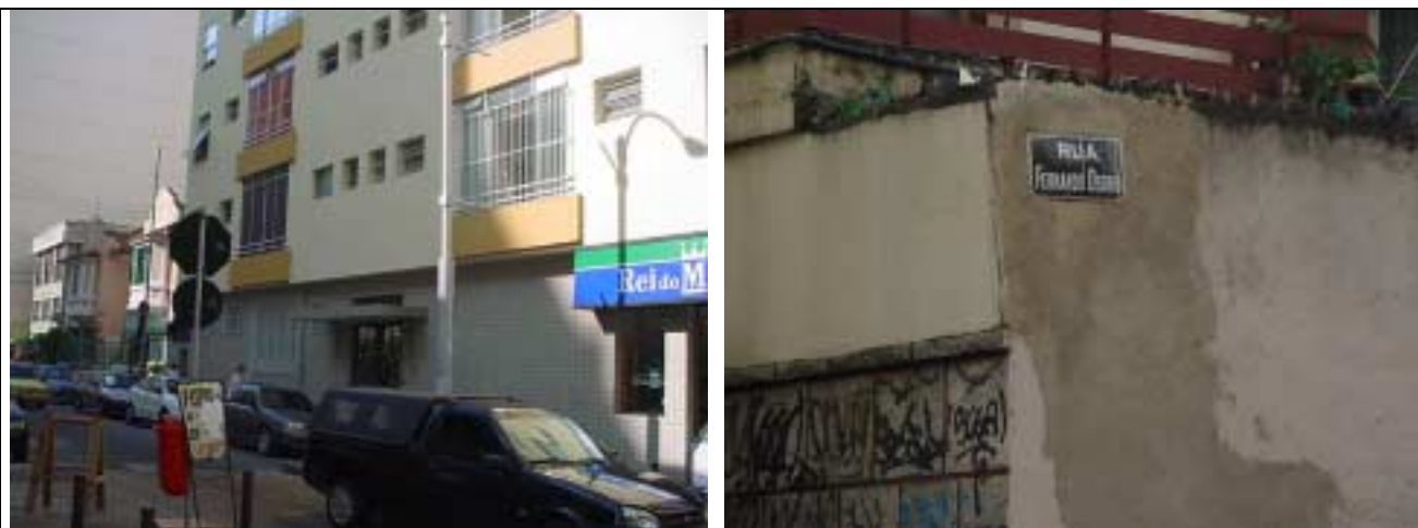
Figura 39 - ausência de placa padrão indicativa do logradouro na Rua Fernando Osório, esquina com a Rua Marquês de Abrantes . Existe uma placa improvisada em local inadequado .