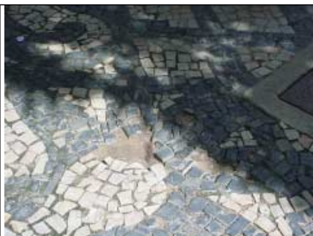
Figura 31 - Ausência de pedras portuguesas em frente à Rua Marquês de Abrantes, nº 19.