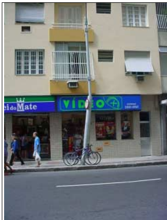
Figura 40 – Poste inclinado na Rua Marquês de Abrantes, nº 87.