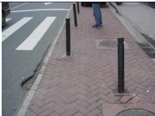
Figura 12 - Defeito no pavimento em frente ao nº 119 da Rua Marquês de Abrantes.