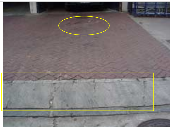
Figura 28 – Afundamento do piso intertravado e fissura na rampa de concreto de acesso à garagem do Supermercado Pão de Açúcar”.