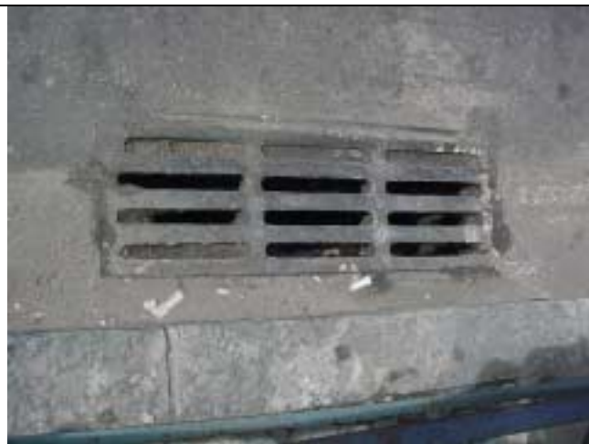
Figura 21 - Bueiro parcialmente obstruído em frente ao nº 212 da Rua Marquês de Abrantes.