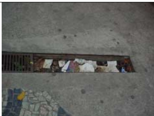
Figura 15 - Canaleta entupida e ausência de grelha na saída da Estação Flamengo do metrô.