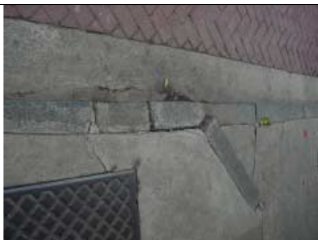
Figura 36 – Meio-fio solto , rachadura na calçada e no pavimento de transição entre a baia e a calçada , em frente ao nº 107 da Rua Marquês de Abrantes.