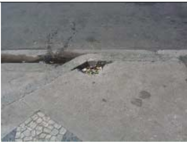
Figura 26 - Calçada danificada na outra extremidade da calçada, à direita de quem sai da garagem da Rua Marquês de Abrantes, nº 168.