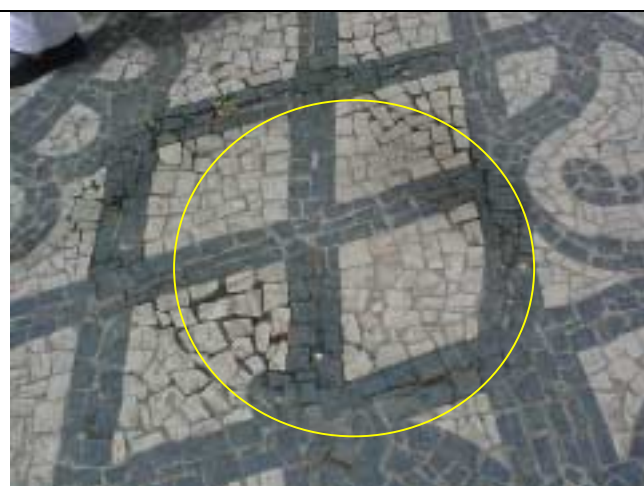
Figura 30 - Afundamento da calçada próximo ao nº 199 da Rua Marquês de Abrantes.