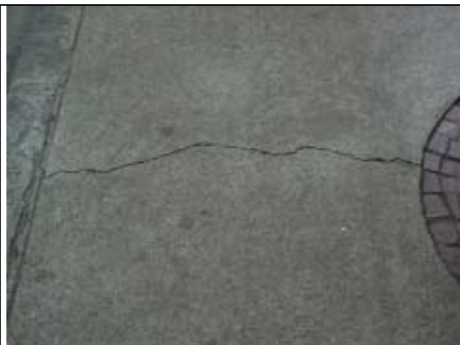
Figura 27 – Fissura na calçada em frente ao nº 219 da Rua Marquês de Abrantes.