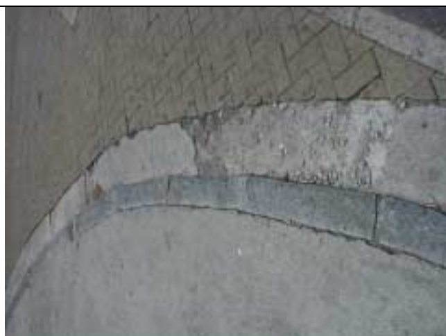
Figura 35 - Detalhe do desgaste do acesso ao posto de gasolina da Rua Marquês de Paraná.