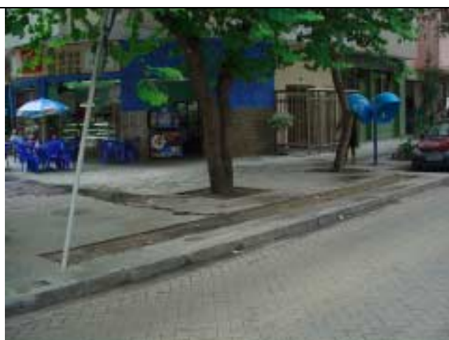
Figura 38 – Poste inclinado e falta de conservação do canteiro junto à Travessa Tamoios, descaracterizando a paginação da calçada.