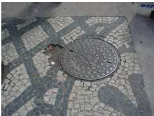
Figura 23 – Ausência de pedras portuguesas em frente à Rua Marquês de Abrantes, nº 142.