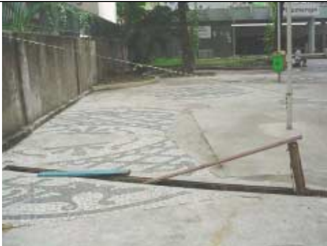
Figura 16 – Aspecto de abandono do acesso à Estação Flamengo do metrô: ausência de grelhas, canteiros sem conservação e faixas de interdição.