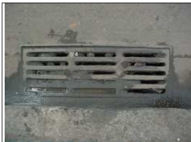
Figura 22 - Bueiro parcialmente obstruído em frente ao nº 64 da Rua Marquês de Abrantes ( bar Trombada).