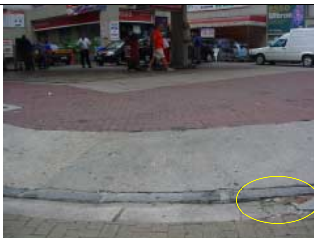
Figura 34 - Detalhe do desgaste do acesso ao posto de gasolina da Rua Marquês de Paraná.