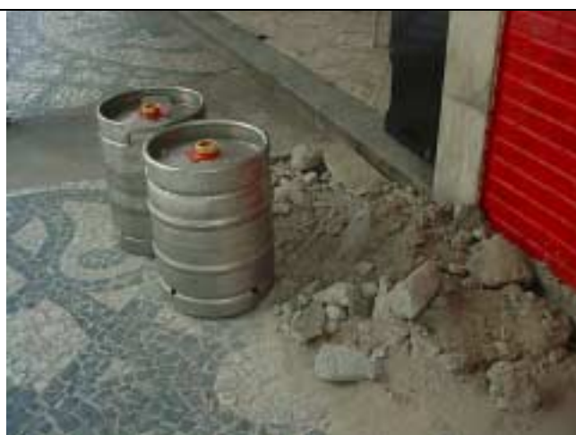
Figura 37 – intervenção na calçada, em frente à Adega Real , esquina da rua Marquês de Abrantes com Rua Paissandu.