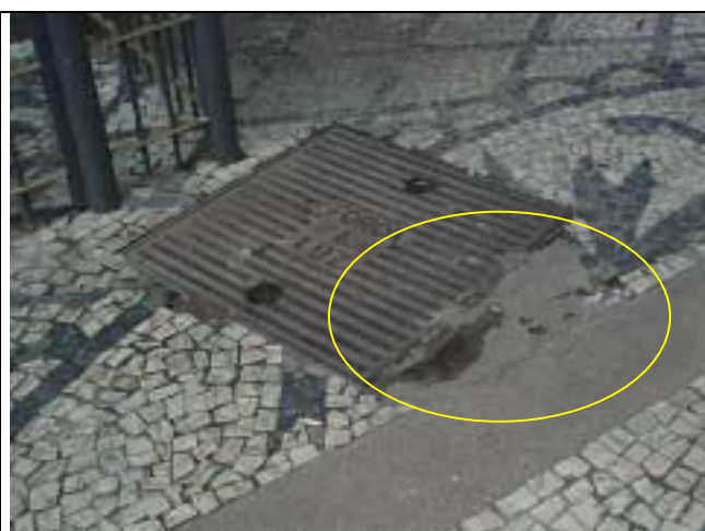
Figura 29 - Descaracterização da paginação da calçada em frente ao nº 39 da Rua Marquês de Abrantes.