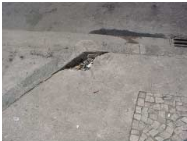
Figura 25 - Calçada danificada em frente ao banco Itaú, Rua Marquês de Abrantes, nº 168.