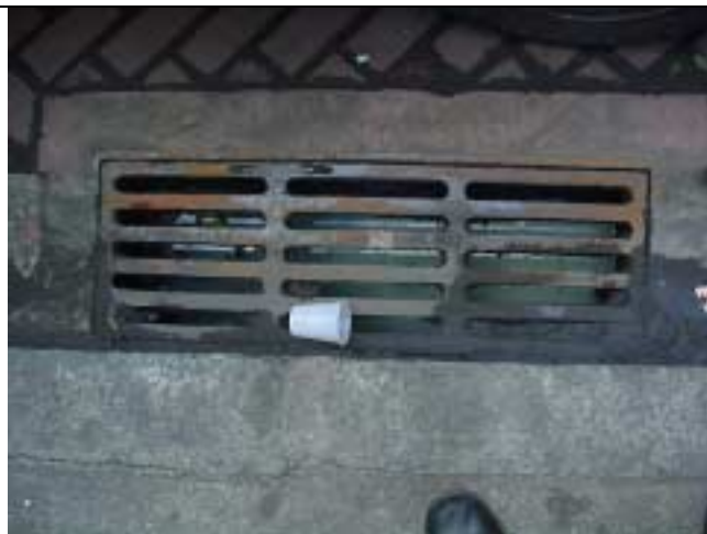
Figura 20 - Bueiro alagado em frente ao nº 178 da Rua Marquês de Abrantes.